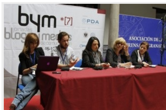
Los miembros de la mesa

Intensa y llena de contenidos la segunda mesa de las jornadas de Blogs y Medios. Bajo el título de ‘Distribución Social en los Medios: Comunidad, Conversación y Caza de la Audiencia’.